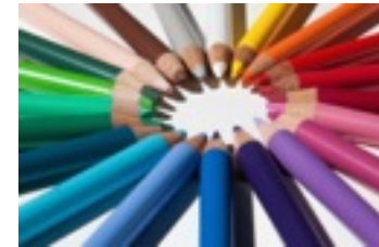
Gammes de couleur