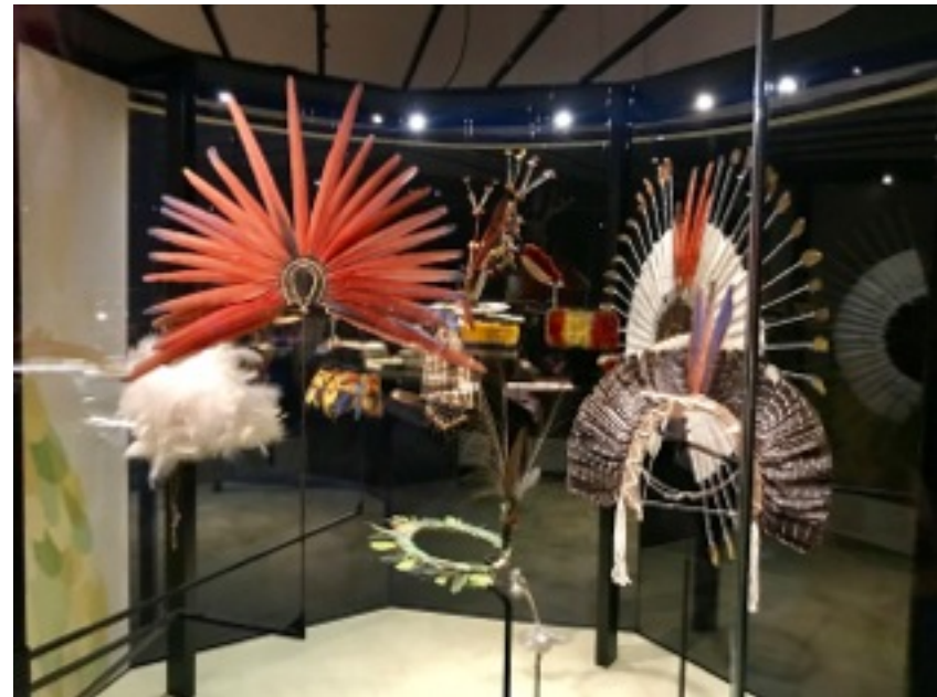
Antoine de galbert, Parure en plume (Amazonie, Brésil, Papouasie, Nouvelle Guinée etc., 2019. Le musée des Confluences (Lyon).