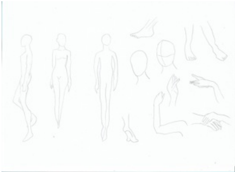
Exemples de modèles

Consigne : Vous choisirez trois accessoires, Puis vous composerez pour chaque accessoire une planche de dessin au minimum A3 en incluant au moins une vue de plein pieds d'une personne avec l'accessoire, et deux autres vues des détails de l'objet. Votre planche sera composée des techniques utilisées, des matériaux de la cible de personne et du prix de vente. Vous en ferez un dossier (avec mise en page : typographies + visuels + textes).