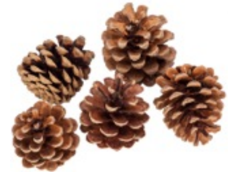
Pommes de pin