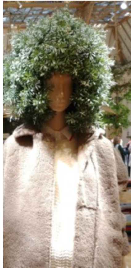
Exemple de perruque en végétal. Galerie La Fayette. Décembre 2017.

Consigne : Par groupe de deux, vous ferez un accessoire de mode choisi en vous aidant des dossiers préalablement constitués.