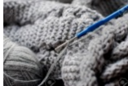
Techniques : tissage/tricot