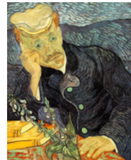
Vincent Van Gogh