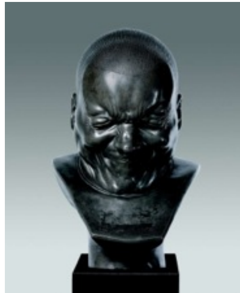
FRANZ XAVER MESSERSCHMIDT, Homme de très mauvaise humeur , 1771.