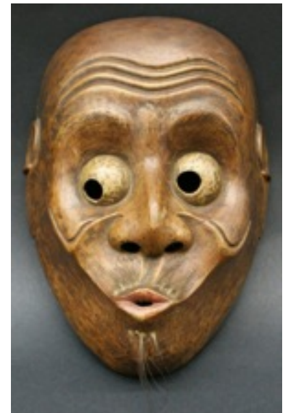
MASQUE RITUEL masque du Kyogen , bois sculpté, peint, poils, cordon, 20x14x7 cm. Musée du Quai Branly.