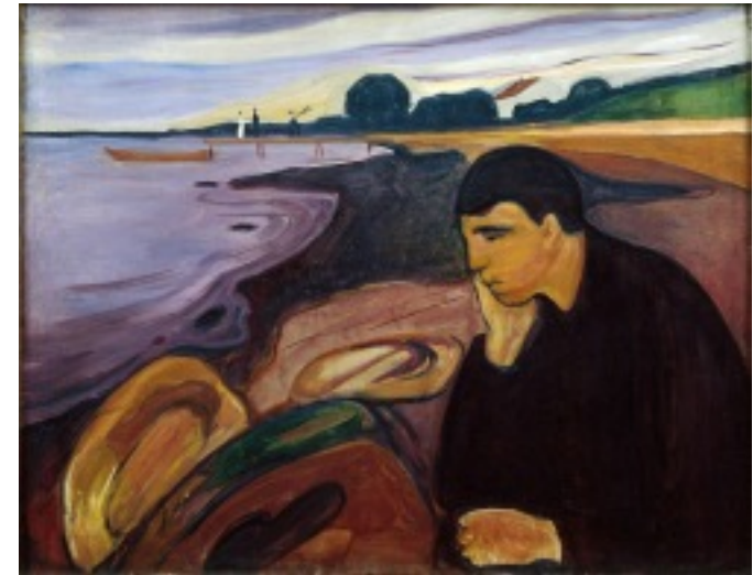
Munch, Mélancolie , 1894.