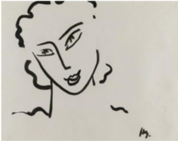
Henri MATISSE, Tête de femme , 1951. Pinceau et encre de Chine sur papier, 48,5 x 65 cm, signé en bas à droite « HM. », collection particulière.

Consigne : Vous déposerez votre visage sur une feuille en inscrivant sur celle-ci votre nom, prénom, classe, titre et expression choisie.