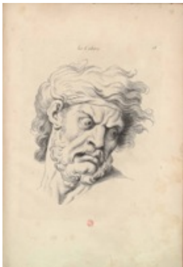
Charles Le Brun

Consigne : Vous inscrirez sous les oeuvres d'art proposées l'expression et comment celle-ci est visible.