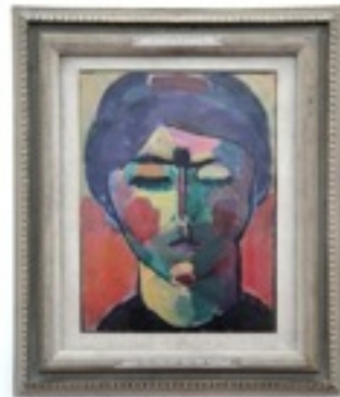
Alexei Von Jawlensky, Tête de femme , vers 1917-18. Huile sur carton toilé, 36,2 cm x 27,2 cm. Cologne, Musée Ludwig.