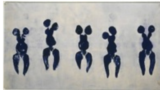
Yves Klein, Anthropométrie de l'époque bleue , 1960. Peinture IKB pigment pur et résine synthétique sur papier maroufflé sur toile, 156,8 x 282,5 cm, Paris.